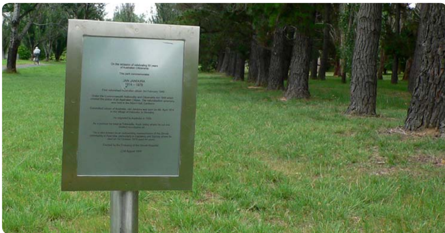
Minulý rok, po tom čo pracovníci slovenskej ambasády zistili, že pôvodná tabuľa v JANDURA PARK bola poškodená, vyhotovili novú a osadili na mieste poškodenej.

Použitá zdroje: www.czsk.net , The Canberra Times