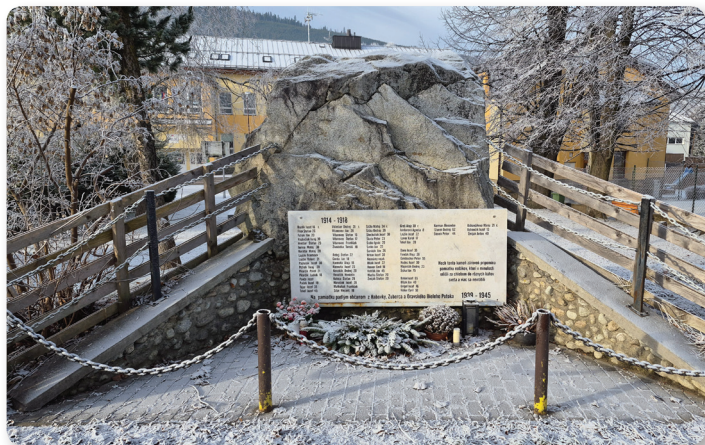
Pamätník pri základnej škole.