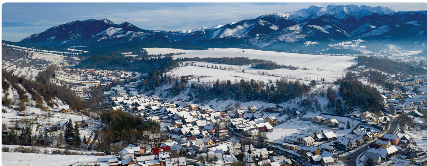
Pohľad na Habovku, v pozadí Západné Tatry.