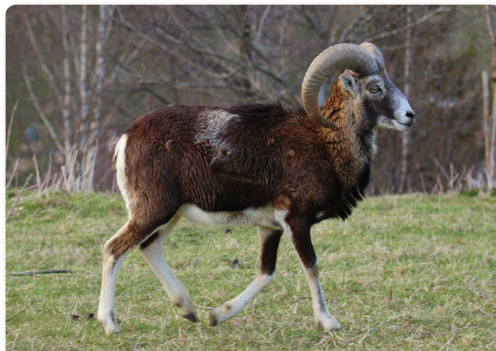
Muflón v obore.