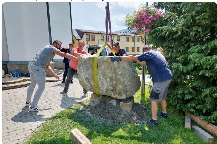
Osádzanie podstavca dalo riadne zabráť.