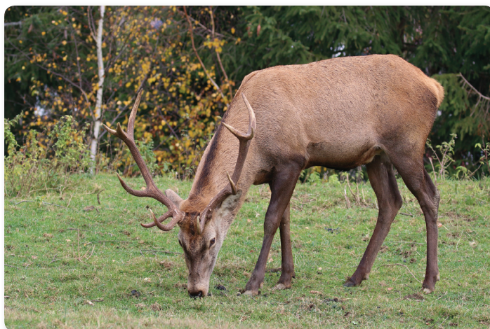
Jeleň lesný karpatská forma.

Napriek nebezpečenstvu a nekonečnej práci ho chov zveri nesmierne baví. Obora je