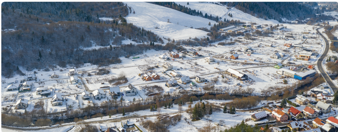
Lokalita Zastudená v roku 2025.