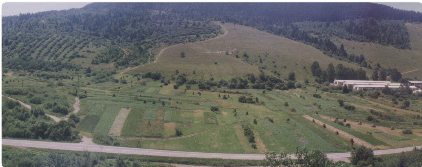
Lokalita Zastudená pred tridsiatimi rokmi.